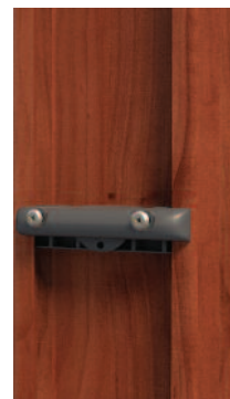
A kerítéselembe oldalirányból beleforgatjuk.

Az „L” profilt önfúró lemezcsavarral rögzítjük. A javasolt csavar: „D” fejű 4,2×16mm méretben. Ez a méretű csavar a műanyag klikk középső rögzítésére is alkalmas. A végleges beállítás után javasoljuk a használatát az esetleges elmozdulások megelőzésére. Természetesen más típusú lemezcsavar is használható, de a hossza ne haladja meg a 16 mm-t.