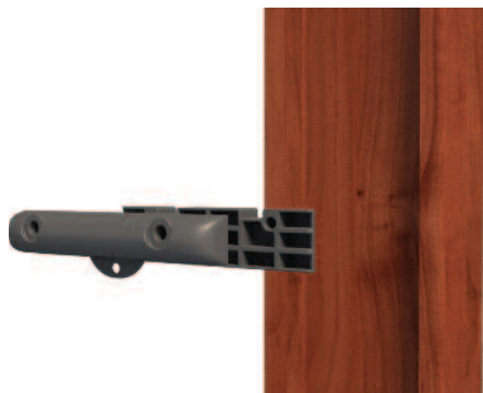
A műanyag rögzítőt (klikk) a hozzáadott 2db csavarral lazán összefogatjuk.