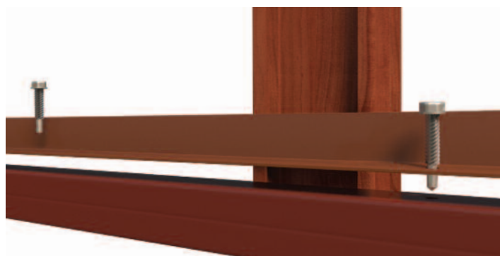
„L” profil rögzítése függőleges elrendezés esetén

Az „L” profilt önfúró lemezcsavarral rögzítjük. A javasolt csavar: „D” fejű 4,2×16mm méretben. Ez a méretű csavar a műanyag klikk középső rögzítésére is alkalmas. A végleges beállítás után javasoljuk a használatát az esetleges elmozdulások megelőzésére. Természetesen más típusú lemezcsavar is használható, de a hossza ne haladja meg a 16 mm-t.